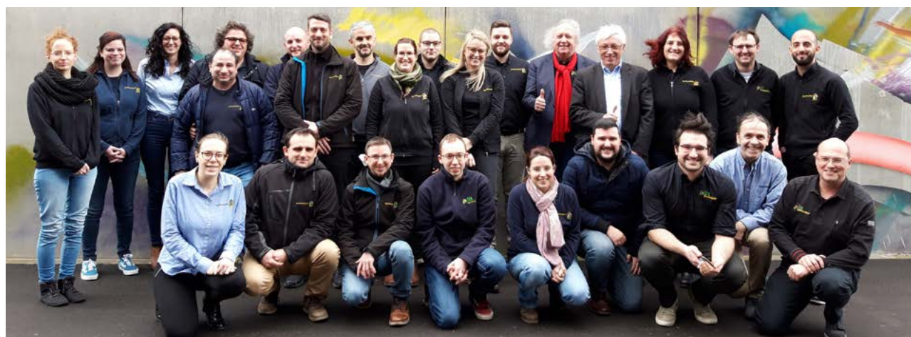
Conseil compétent pour une gestion écologique des déchets

L'offre de la SuperDrecksKëscht® fir Betriber s'adresse à tous les acteurs de l'économie luxembourgeoise, qu'il s'agisse des entreprises ou des établissements des secteurs privé et public. Voici quelques exemples : industrie, artisanat, gastronomie et tourisme, secteur bancaire, administrations, écoles. Même les exploitations agricoles utilisent de plus en plus l'offre. Des concepts spéciaux existent pour les chantiers ou habits collectifs (résidences). Le concept est incorporé dans d'autres activités nationales, par ex. le Pacte sur le climat ou le label national de construction durable (LENOZ).