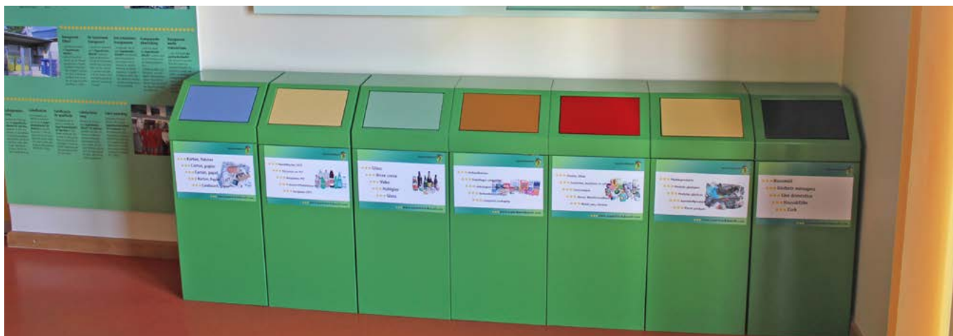
Collecte sélective des produits et prévention - deux principes inséparables

Pour gérer dûment les déchets, les producteurs de déchets doivent satisfaire à des exigences rigoureuses. La loi modifiée du 9 juin 2022 sur la gestion des déchets et la stratégie nationale Zero Waste stipules explicitement que les entreprises doivent tenir compte de la hiérarchie des déchets prescrite par l'UE. Lors de la gestion des déchets, la prévention et le recyclage sont au premier plan. Viennent ensuite le recyclage du matériel au sens de l'économie circulaire, puis toute autre valorisation (par ex. récupération énergétique) et enfin l'élimination finale. Une gestion des déchets intelligente est non seulement écologique et durable, mais permet également de réduire les coûts et de renforcer ainsi la compétitivité.