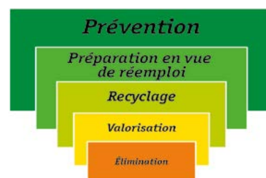
hiérarchie des déchets UE

Les partenaires de l'initiative du ministère de l'Environnement, du Climat et de la Biodiversité, actifs dans le secteur depuis 1992, sont la Chambre des Métiers et la Chambre de Commerce. Pour eux, la SuperDrecksKëscht® fir Betriber est un outil important de mise en œuvre du plan national de gestion des déchets et du plan national de développement durable dans le but de mettre en place une gestion écologique protégeant l'environnement et ménageant les ressources énergétiques et naturelles. Cela signifie une protection du climat pratiquée.